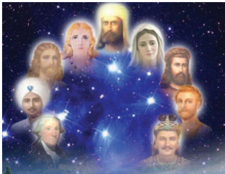
Verschillende meesters van wijsheid

Iets wordt al snel voor waar aangenomen puur en alleen vanwege de mooie verpakking of de leuke wijze van presentatie. De ware herkomst (Meester of astrale wereld of projecties) is vaak niet te achterhalen. En dit terwijl er in de meeste spirituele tradities veel gezegd en onderwezen is over het belang van de eigen intuïtie bij het onderzoeken van de wereld en de waarheid (zie: Roberto Martelli, "De Apocalyps", 2011).